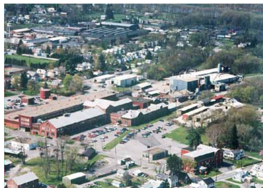
In den USA befürchten viele Industrieunternehmen, dass mehr Arbeitssicherheit ihre Wettbewerbsfähigkeit verschlechtern könnte.

stolze 87 Prozent gestiegen. Mit Präsident Obamas Unterschrift Ende März trat ein Gesetz in Kraft, das das gesamte US-Gesundheitswesen in den nächsten Jahren revolutionieren wird. In Folge kommen in den nächsten Jahren vor allem auf Mittel- und Großbetriebe viele Pflichten und Regelungen zu. Die größte Neuerung geschieht im Jahr 2014, denn spätestens zu diesem Zeitpunkt müssen Betriebe mit mehr als 50 Beschäftigten ihren Mitarbeitern verpflichtend einen Versicherungsschutz anbieten. Die US-Industrie war jedoch gegen einen solchen verpflichtenden Versicherungsschutz, denn sie befürchtet globale Wettbewerbsverzerrungen und noch mehr staatliche Eingriffe in die Regelung der Arbeitsverhältnisse. Für die Papierindustrie kam zusätzlich dazu, dass bei Beschluss der neuen Gesundheitsgesetzgebung gleichzeitig auch eine für sie rentable Gesetzeslücke geschlossen wurde. Durch den Einsatz von Schwarzlaube für die Energiegewinnung wurden alleine 2009 über sieben Milliarden Dollar aus für erneuerbare Energiegewinnung vorgesehenen Subventionen erwirtschaftet. ■