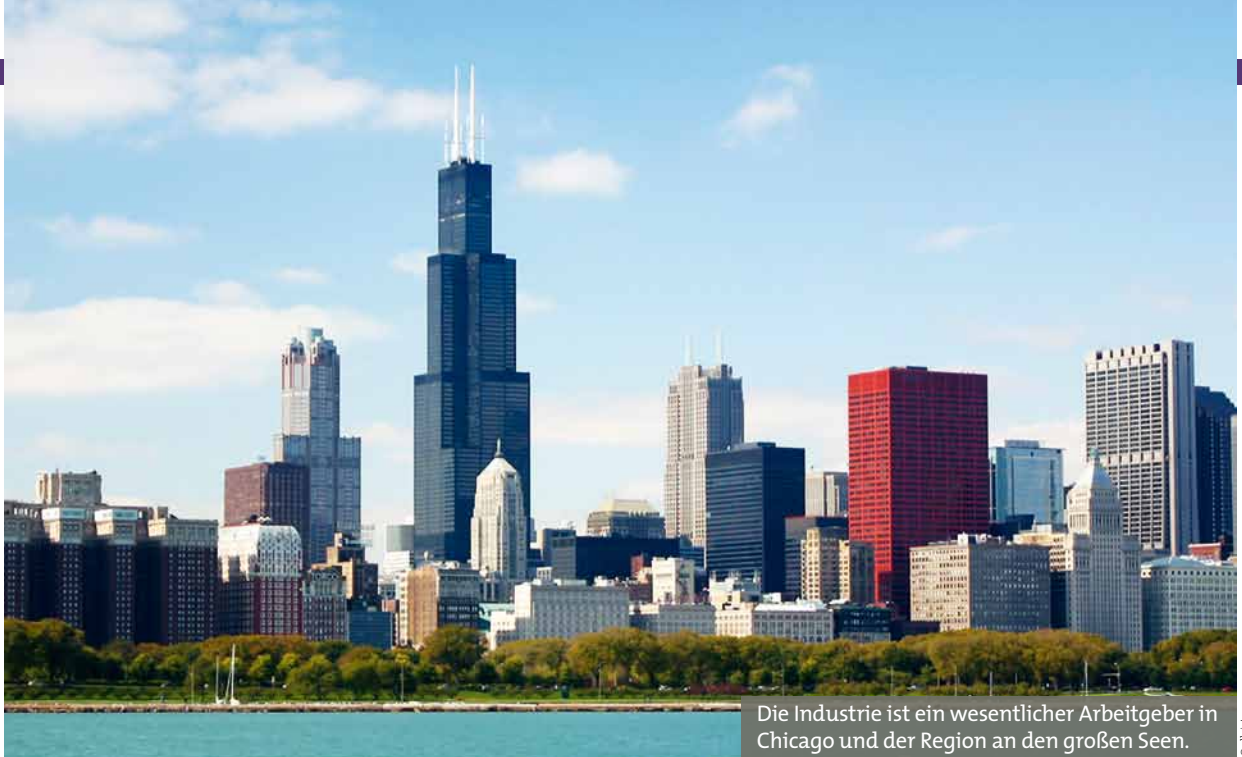
Die Industrie ist ein wesentlicher Arbeitgeber in Chicago und der Region an den großen Seen.