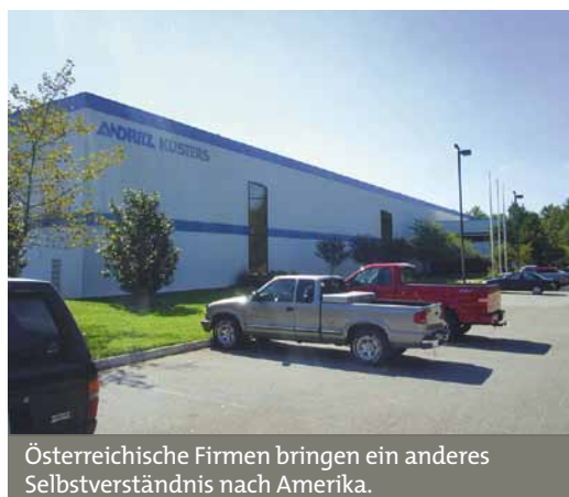
Österreichische Firmen bringen ein anderes Selbstverständnis nach Amerika.